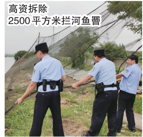
高资拆除 2500平方米拦河鱼罾

为深入贯彻落实长江“十年禁渔”的系列重要批示指示精神,近日,丹徒区农业农村局联合高资街道政府和高资派出所,对辖区通江支流高资港段的拦河鱼罾,进行依法拆除。此次行动共拆除1条2500平方米的大型拦河鱼罾、钢制罾基座4个。记者了解到,拦河鱼罾俗称“扛网”“抬网”“大罾”等,仿佛是“肠梗阻”,鱼类不管大小一网尽收,是导致天然野生鱼类资源下降的禁用渔具。