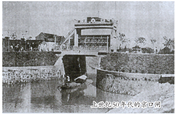
上世纪50年代的京口闸

京口闸的规模为单孔节制闸,净宽8米,净高10.7米,闸底高程0.5米,闸顶高程11.2米,引排能力为80立方米/秒,配有21吨卷扬式启闭机一台。通航能力最大吨位60吨,年最大吞吐量35万吨。