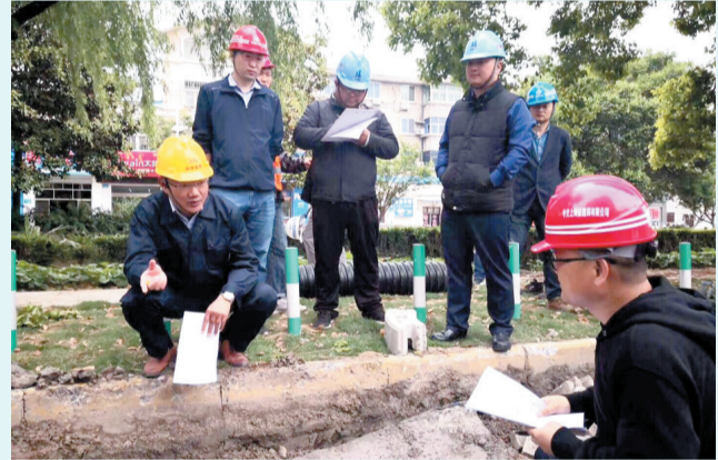
加强治水工程质量监督