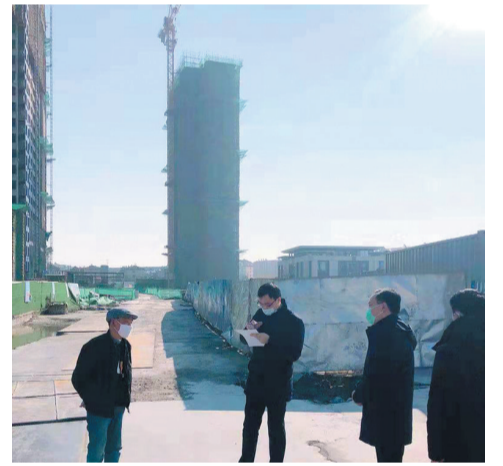
建筑工地疫情防控