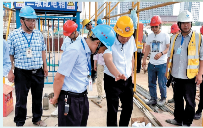
建筑工地安全生产检查