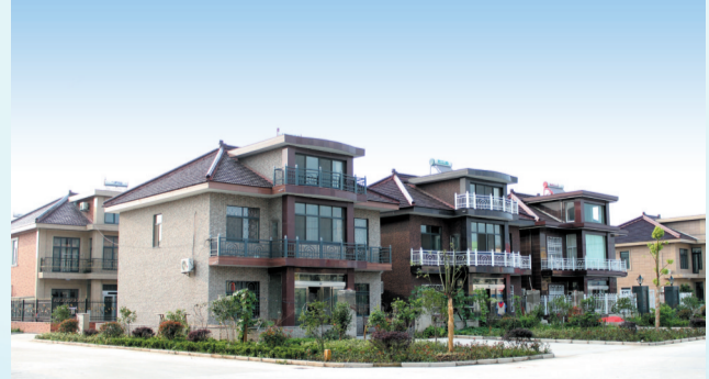
美丽宜居村庄：新坝公信社区公信新村