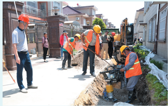
农村生活污水治理工程