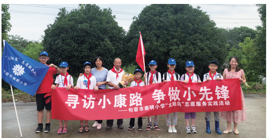
寻访小康路 争做小先锋

建设科技场馆打造精品社团促科技品质提升。坚持全区一盘棋，因校制宜，协调发展的原则，统筹全区各项资源，在各片区建设科技场馆，同时将科技精品社团打造融入学校社团建设工作。石马中心小学人防教育基地运用科技手段布展多个场馆，学生可现场体验与操作演练，内容涉及防空、交通、地震、消防等多个方面；高桥中学建有航空模型馆，组建的航模社团既有理论教学，也有模型制作及模拟飞行；荣炳中心小学3D打印体验馆、宝堰实验小学梦想科技体验馆让学生充分感受科技魅力，激发浓厚探究兴趣。