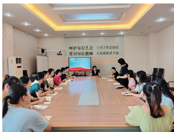
新生“云家访”工作启动

近日，京口区贺家弄幼儿园组织党员集中政治学习，分享学习体会。大家表示，一定要立足本职岗位，发挥模范作用，在工作和生活中勇于自我革命，不断自我净化、自我完善、自我革新、自我提高，切实为幼儿教育事业“跑起来”贡献力量。