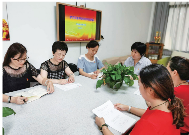
假期不忘政治学习

近日，丹徒高级中学组织教师参加暑期教师综合素质提升高级研修班。研修班邀请专家学者开设专题讲座，内容包含新高考背景下学校发展的思考、基于新高考方案的高中课程实施、新高考背景下的教研组备课组建设、教师执行力打造、课堂评价的反思和策略等等。