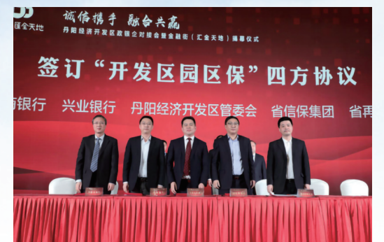
兴业银行丹阳支行“园区贷”助推丹阳经济开发区高质量发展