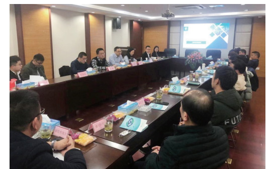
丹阳科技型企业融资对接会