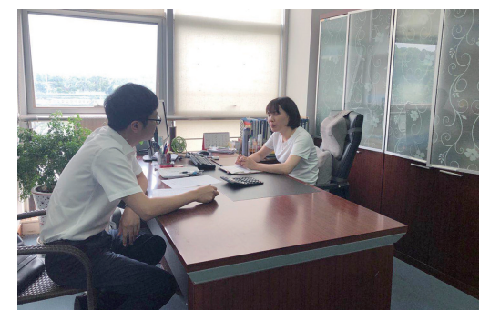
客户经理前往农业企业绿华园科技有限公司,向负责人介绍“兴农贷”产品。