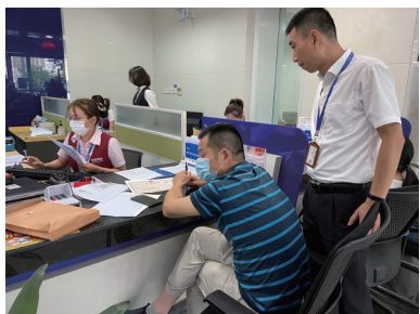
柜面指导客户办理业务

2020年以来,兴业银行镇江分行在各级党委政府的关心和人行、银保监等监管部门的支持下,积极克服新冠肺炎疫情不利影响,围绕国家“六稳”“六保”工作任务,一手抓疫情防控,一手稳金融服务,积极贯彻落实总行“商行+投行”战略服务地方经济发展,在支持企业复工复产和实体经济等方面精准发力,通过商行加强普惠金融服务,通过投行加大重点实体客户投入,推动各项业务取得较好发展。6月末,本外币各项存款余额达到214.4亿元,较年初增加48.68亿元,增幅29.37%,各项资产余额311.6亿元,一举突破300亿大关。