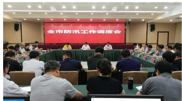
19日晚紧急召开句容全市防汛工作调度会