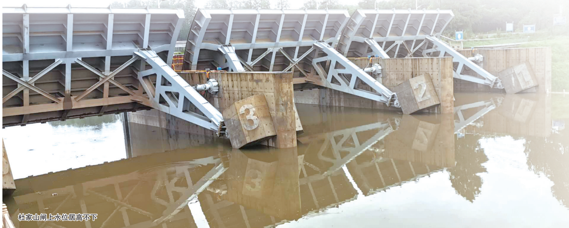
杜家山闸上水位居高不下