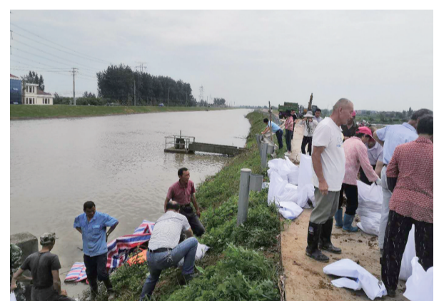
宝华镇王闸头泵站漏水正在抢修