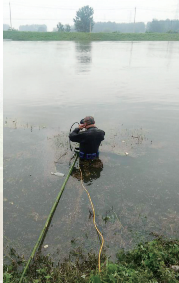
下蜀引江河河堤潜水封堵漏洞