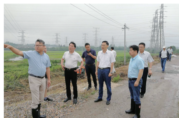
省防指督导句容防汛工作

目前，下蜀镇、宝华镇沿江河道有300名干部群众日夜巡查，两镇防汛物资充裕。必要时，市防指仓库储备的草包13.51万只、编织袋21.48万只、木材118立方米可及时调配。