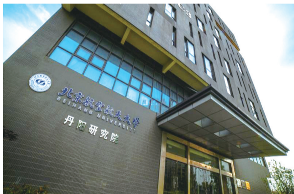
集聚14位院士的北航（丹阳）研究院