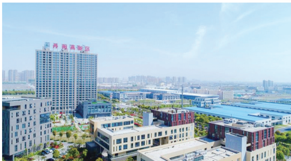
欣欣向荣的丹阳高新区