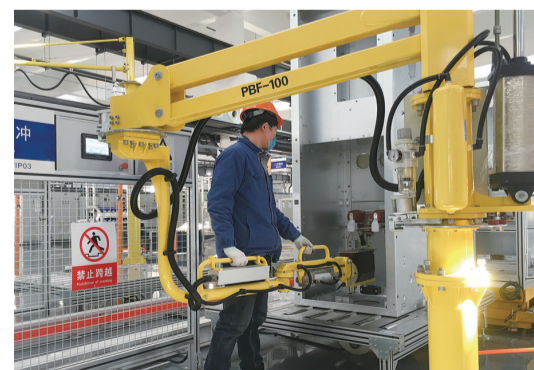
亿能电气生产车间

为适应市场，拓展更大的发展空间，亿能集团一直以来秉持“科技、人文、责任”的核心价值观，全面推行精细化管理，实行企业架构下的品牌、质量、营销、研发等方面的统一管理。今后，亿能集团将继续坚持自主品牌与外资品牌复合扩张的战略，加大ABB母线槽、智能型配电柜等输配电产品的技术研发投入，完成“智能型开关柜自动化成套生产线技术改造”项目，并完善智能工厂大数据平台建设，抢抓当前市场机遇，将本土特色产品做专、做精、做特、做新。