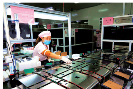
环太集团生产车间

抢抓“长江经济带建设”“一带一路”等多重战略机遇，扬中经开区将加快新兴产业发展，逐步建设成为长江“黄金水道”上重要的临港物流基地和高端装备制造集聚区。