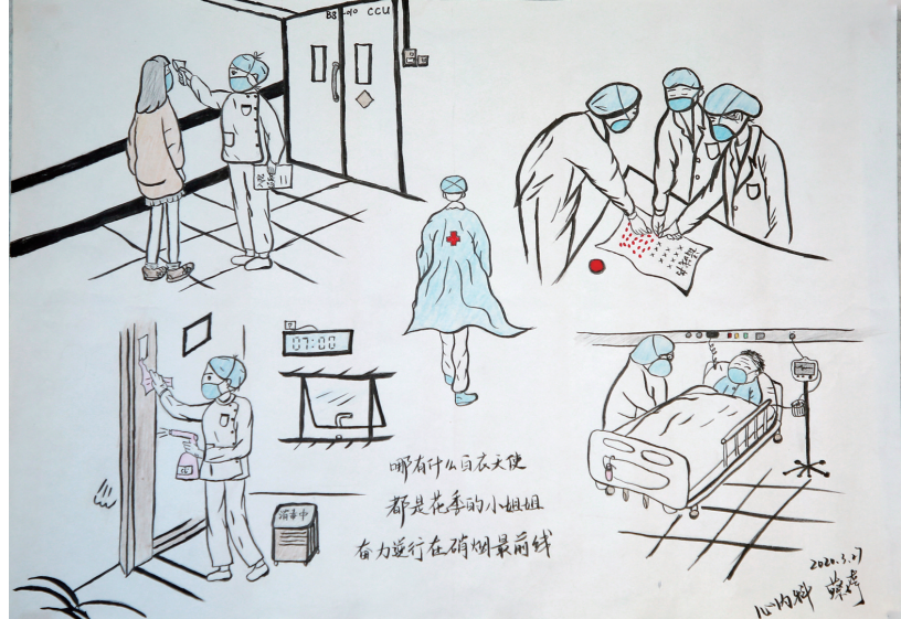
作者：市第一人民医院内科护士蔡婷