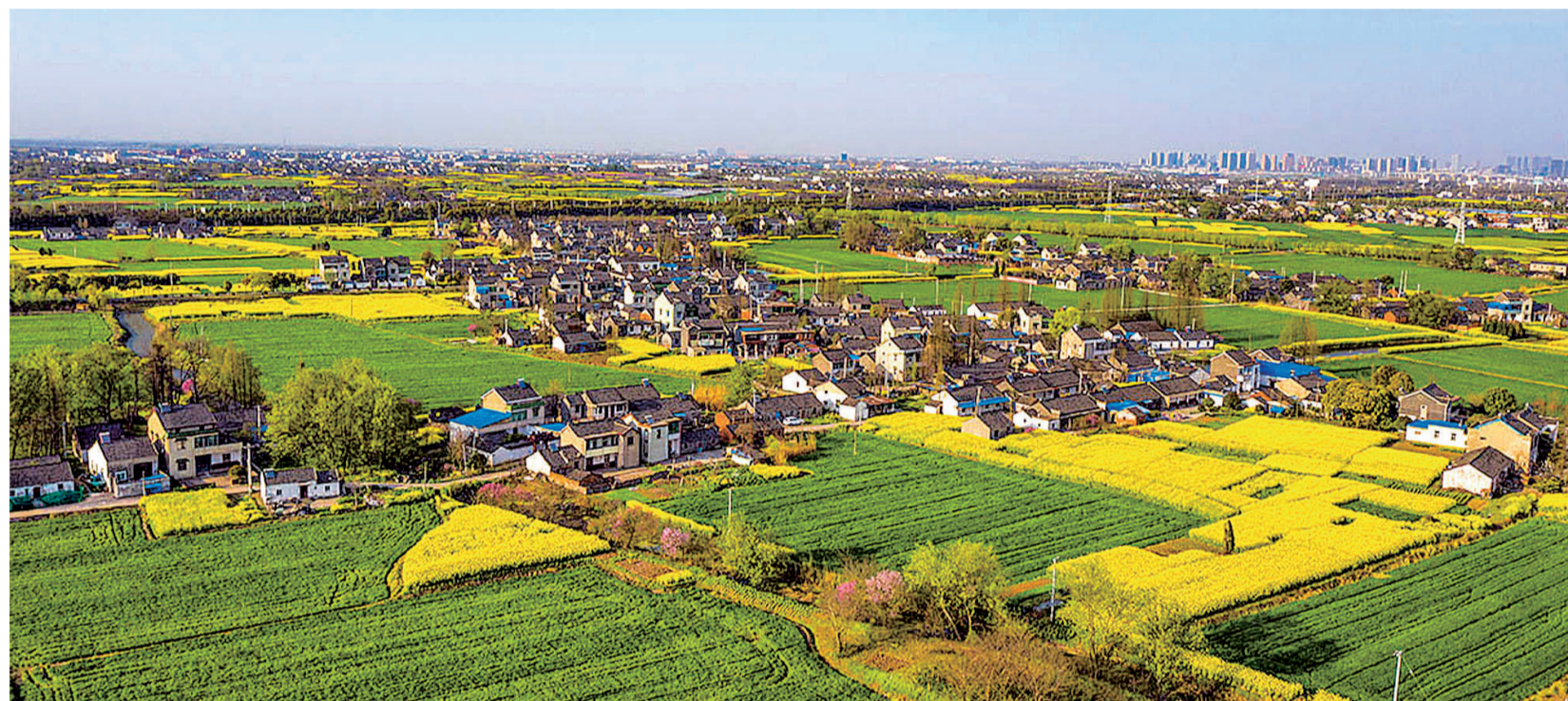
大路镇的美丽春色。

今年是全面实施乡村振兴战略的关键年，新区坚持统筹推进、分类治理，累计发动村庄清洁行动92次、动员3257人次参与，清理村内河塘沟渠76处、清运农村陈年垃圾等1768立方米。新区社会发局相关负责人介绍，下一步将以建设生态宜居美丽乡村为导向，持续加快补齐农村人居环境短板，为打造乡村振兴“大景区”奠定坚实的生态基础。 施阳 张燕