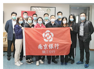
参加无偿献血员工现场合影留念。

献血活动持续近4小时,共有36名员工成功献血,累计献血10950毫升。(蒋莉莉 张凤春)