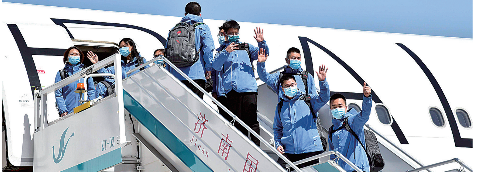
3月28日，山东省赴联合国联合工作组在济南遥墙国际机场登机，赶赴英国，慰问在英华侨华人、中资机构和广大留学生，支援当地抗击疫情。

“对于疫情严重国家，确实有困难急需回国的留学人员，党和政府将及时采取必要措施，协助他们逐步、有序回国。”马朝旭说，民航局有关负责人已经表示，对需求集中、飞行目的地有疫情防控保障能力的城市，将视情况启动重大航空运输保障机制，及时开通临时航班和包机。他同时提醒有关留学人员和在海外的中国公民密切关注中转国的入境政策，购票以及登机前务必要和航空公司核对好航班情况，尤其是后续航班的情况。如遇特殊情况出现滞留，要及时联系中国驻当地使领馆寻求协助，或拨打24小时畅通的领事保护电话。