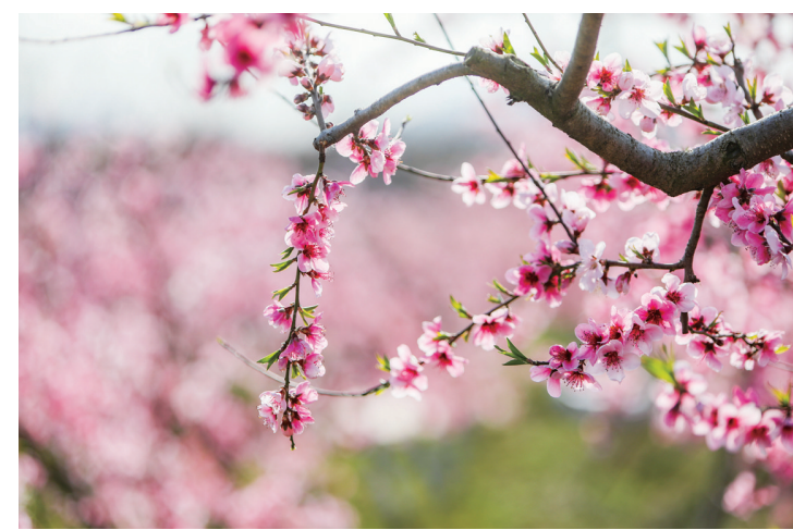
在丹徒荣炳盐资源区胜利村的桃林里桃花已经盛放,大片的“红色海洋”也吸引了过往市民游客驻足观赏拍照。据了解,该桃林种植品种为秋红1号,预计在9月底成熟采摘。