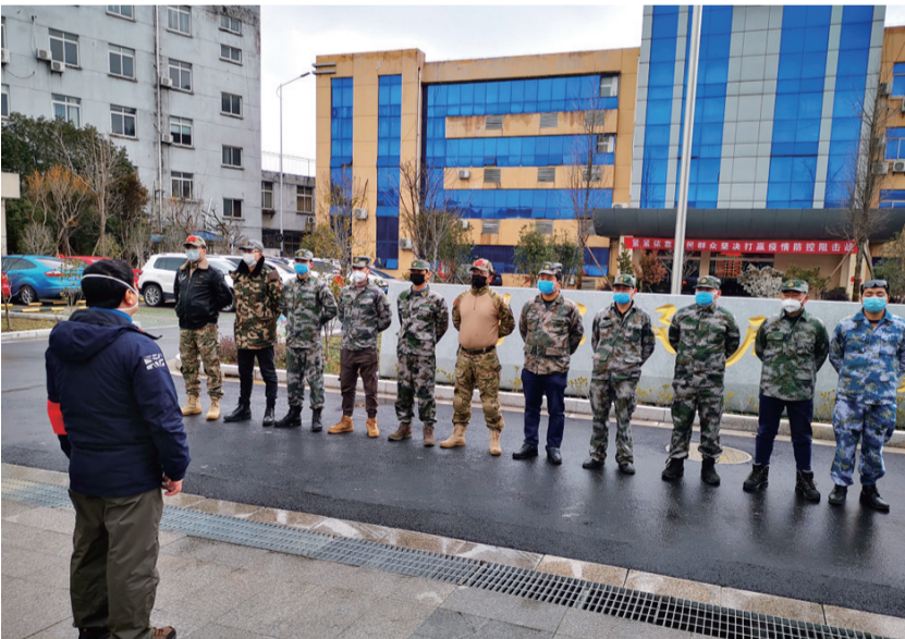
退役军人志愿者与局机关党员组成老兵突击队开展社区防疫摸排。