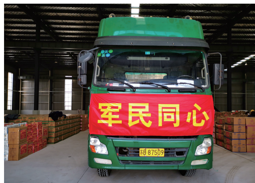
省退役军人就业创业示范基地兵创公司以及镇江退役军人踊跃为湖北一线军队医护人员捐赠。