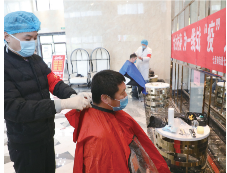
从“头”开始 迎接春天

截至目前,大吕村8位仍在老家的外地种田大户的农田,已全部做到委托代管,保证了农业生产如期进行。另外,为确保疫情防控期间的农资安全,大吕村还要求农资经营网点采取送货上门的方式进行销售,减少人员流动。(谭谊 余记其)