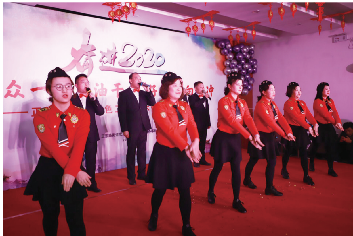
街道春晚迎新年 日前,正东路街道开展“奋进2020,万众一心加油干,美好正东向前冲”街道春晚,展示职工风采,喜迎农历新年。

本报讯 春节将至,为了在社区倡导风清气正的廉政氛围,日前,和平路街道桃一社区和金山街道风车山社区分别开展“廉政春联进社区 风清气正迎新年”活动。 记者在活动现场看到,书法家们挥毫泼墨,将一副副饱含勤廉寓意的“廉政春联”作为新年礼物,赠送给辖区内的党员和居民,给大家送上了一份特殊的“年货”。 据两家社区负责人介绍,开展廉政春联进社区活动,是为了增强社区廉政工作的感染力、吸引力和影响力,希望大家重视廉政文化建设,营造“尊廉”“崇廉”“爱廉”的氛围。(孙晨飞 润轩 姚娜)