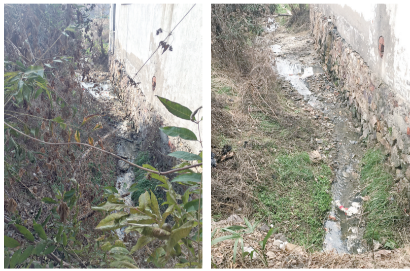
高新区蒋乔街道乔家门社区东三组23号民居旁的水沟整治前后对比图

农村人居环境整治作为乡村振兴战略的首场硬仗，受到市委、市政府的高度重视。在日前全市农村人居环境整治提升推进会，暗访人员对会上曝光的一些问题进行回头看，过程中发现在这些被曝光整改的范围内，依旧存在问题，并就这些问题进行曝光。