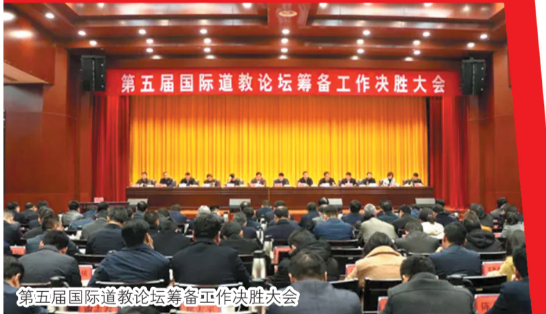
第五届国际道教论坛筹备工作决胜大会