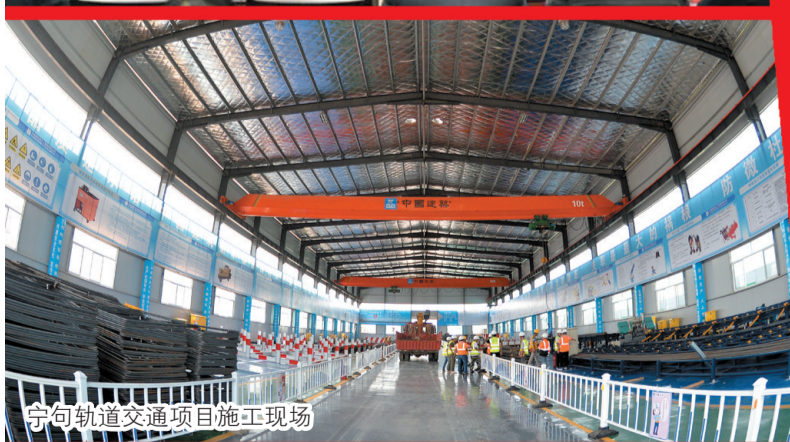
宁句轨道交通项目施工现场