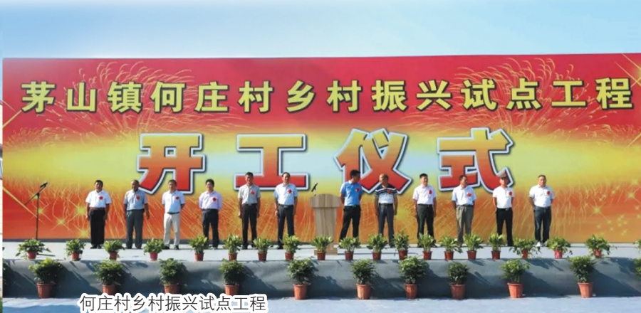
何庄村乡村振兴试点工程