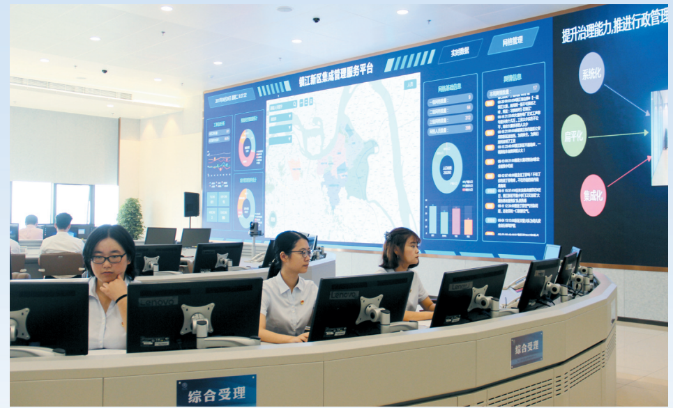
集成管理指挥中心