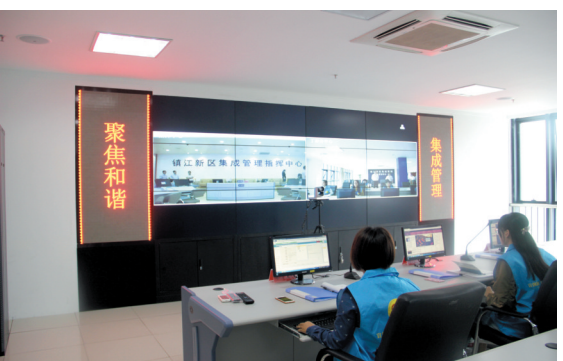
镇江新区丁卯街道集成管理指挥中心