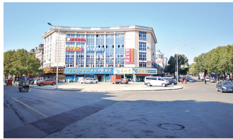
图为整治后的宏成路港口路。祝青 摄

新区综合疏导市场的经营管理,秉持“管理为民、服务商家、顺应发展”的思路,确保综合疏导市场管理更加人性化,更具包容性,为居民营造洁净、有序的购物环境,为推进更高水平文明城市创建贡献力量。 (朱晓雨 孙浩 张燕)