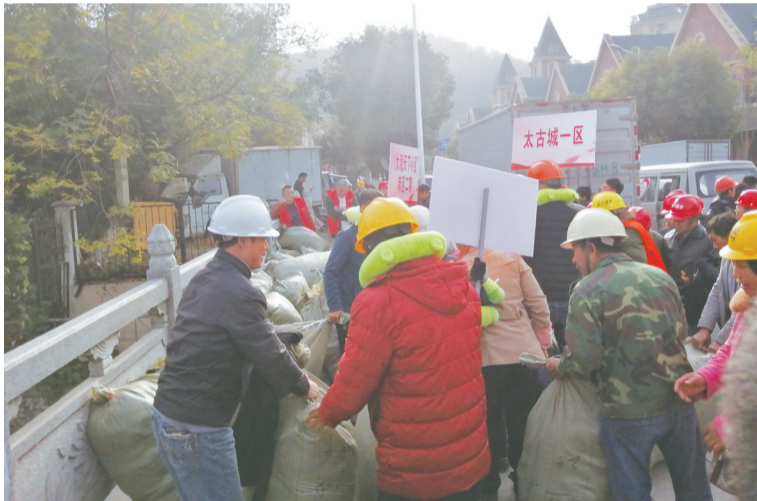
农民工兄弟领取冬衣。