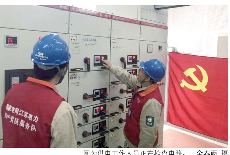
图为供电工作人员正在检查电路。 治理管控工作,做好月、周、日分析监控,整治不合理线损线路共12条;规范开展配电自动化终端运维检修,累计终端巡视378台次,处理终端离线及各类缺陷共86条次,圆满完成了今夏的供电保障工作。(王礼 刘婧)

绍,早在这个电站申请用电的时候,供电的专业人员就陪同用户一起到现场进行了勘察,并出具了供电方案答复书。出于服务民生的考虑,对此处的外线电缆,他们决定由供电公司出资进行设计施工。 新区供电服务中心大客户经理祝俊杰介绍,这是靠近江边的一个泵房,主要服务防汛抗洪。针对客户夏季用电的需求,供电公司主动服务,在客户内部工程完成前就已经把外部工程已经施工到位,随时准备客户来接电。“当天的整个装表通电工作历经两个小时,供电师傅们的工作服已经被汗水浸透,直到下午1点多钟还没有吃上午饭。” 就是凭借这样的干劲,今年6月至今,新区供电不断强化配网精益化运维,提升设备健康水平。据不完全统计,他们开展线路巡视183条次,消除缺陷325处;持续加强分线线损