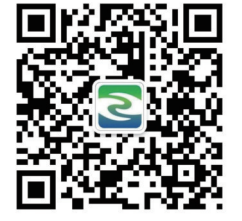
更多新闻请关注 新区发布

本报讯 近日,新区开展校外培训机构消防培训活动,来自全区40多家、近70名校外培训机构负责人参加了活动。 活动上,来自市安居防火培训中心的专家,结合具体事例,就如何正确应对火灾进行了讲解。 专家指出,发生火灾时,不要贪恋财物,应及时从火场逃生。逃生时,不能乘电梯,因为电梯随时可能发生故障或被火烧坏,应沿防火安全疏散楼梯朝底楼跑。当有被困在室内的危险时,可用湿毛巾、湿被子等物裹好整个身体后向外冲出。如果浓烟太大,则可用湿口罩或湿毛巾捂住口鼻后,爬行穿过险区。如果火势很大,应趴在地上大声呼救;也可以将楼梯间的窗户玻璃打破,向外高声呼救,让救援人员知道你的确切位置,以便营 救。在公共场合,应养成观察紧急出口位置的习惯,同时要了解到灭火设施的摆放位置,以便在火灾发生时可以冷静应对。 培训结束后,所有人员进行了一次火灾逃生演练,并集中学习了逃生绳的使用方法。(陆欣)