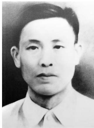
这是烈士程雄写给父母的信。

儿这次为了民族,为了阶级,为了可爱的家乡,为了骨肉相连的姊妹,求得生存和幸福,儿不得不来信辞别双亲大人,如果不能活着的话,双亲大人应保重玉体,抚育好姊妹。生活难度的话,可卖掉土地、房屋,把生命糊过来,到十年八年我们就好了,有饭吃、有衣穿、有房子住。现在儿就要离开驻地,走上最前线消灭敌人,保卫中华,望双亲不要悲伤挂念。儿为伟大而生,光荣而死,是我做儿子最后的心意,罪甚!罪甚!