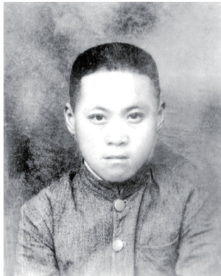
李云鹏烈士一九三五年毕业照

1943年3月18日,日军在盐阜一带对我军民进行残酷“扫荡”,李云鹏所在新四军3师7旅19团2营4连驻扎在淮阴刘皮镇西南刘老庄,全连指战员誓死固守阵地,从拂晓到黄昏先后击退敌人6次进攻,毙伤敌370余人,终因敌众我寡,全连82位英雄全部壮烈殉国,“刘老庄连”的英勇事迹也永载史册。