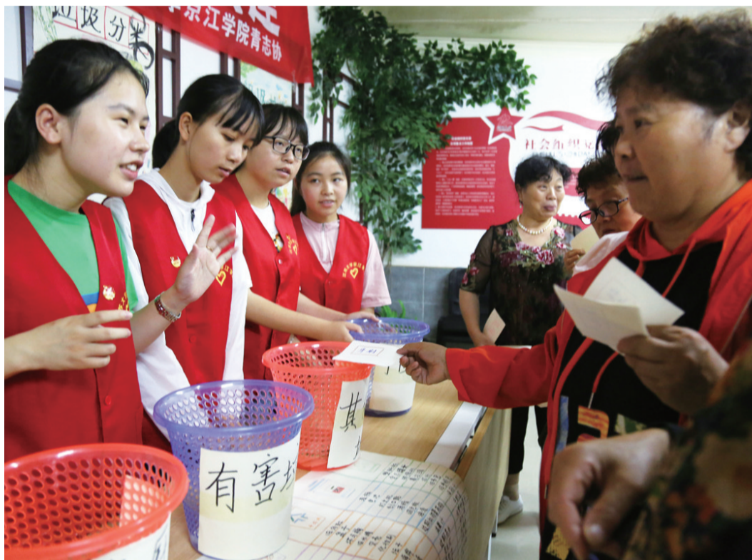
垃圾分类齐参与 文明社区共创建

社区负责人表示，通过这次活动，让辖区居民对见义勇为的认识有了进一步的提高，提高同违法犯罪行为做斗争的意识，在辖区范围内形成弘扬正气的良好氛围。（孙晨飞 王婧）