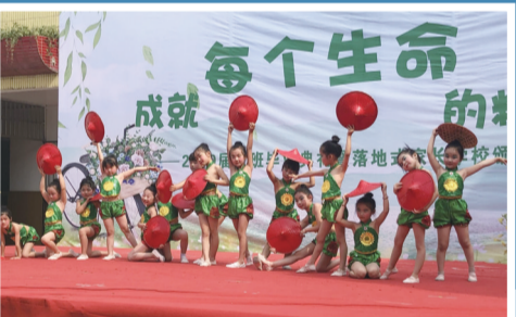
日前,句容市袁巷中心幼儿园举办了“再见了,幼儿园!”大班毕业典礼,家长和小学资深班主任共同参加活动,见证这个重要时刻。

近日,扬中市三茅中心幼儿园举行大班毕业典礼暨落地式家长学校颁奖活动。这是每个大班孩子三年来的全面展示,更是幼儿园办园宗旨“成就每个生命的精彩”的精彩诠释。