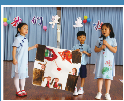
近日,句容市文昌路幼儿园大班小朋友和家长们欢聚在一起,举行了“感恩成长 梦想起航”大班毕业典礼。

近日,句容市下蜀镇中心幼儿园举行了大班毕业典礼,带着孩子和家长共同寻找成长足迹。歌曲表演、才艺展示、诗朗诵、小合唱……精彩的节目赢得了家长们热烈的掌声和喝彩。