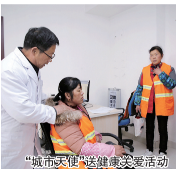
“城市天使”送健康关爱活动

社区还将慈善活动从“线下”延伸到“线上”,为50位符合政府购买服务条件的老年家庭,安装了网络终端。家里有了互联网,这部分老人迈入智能家居养老的现代化生活,一键视频对讲,让老人们发生任何问题能及时和社区联系。此外,视频医生问诊、远程健康管理、智能家居看护等功能,不仅丰富了老年人的精神生活,也让更多符合慈善救助的弱势群体能够享受到慈善的关爱。