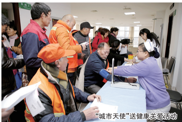
“城市天使”送健康关爱活动