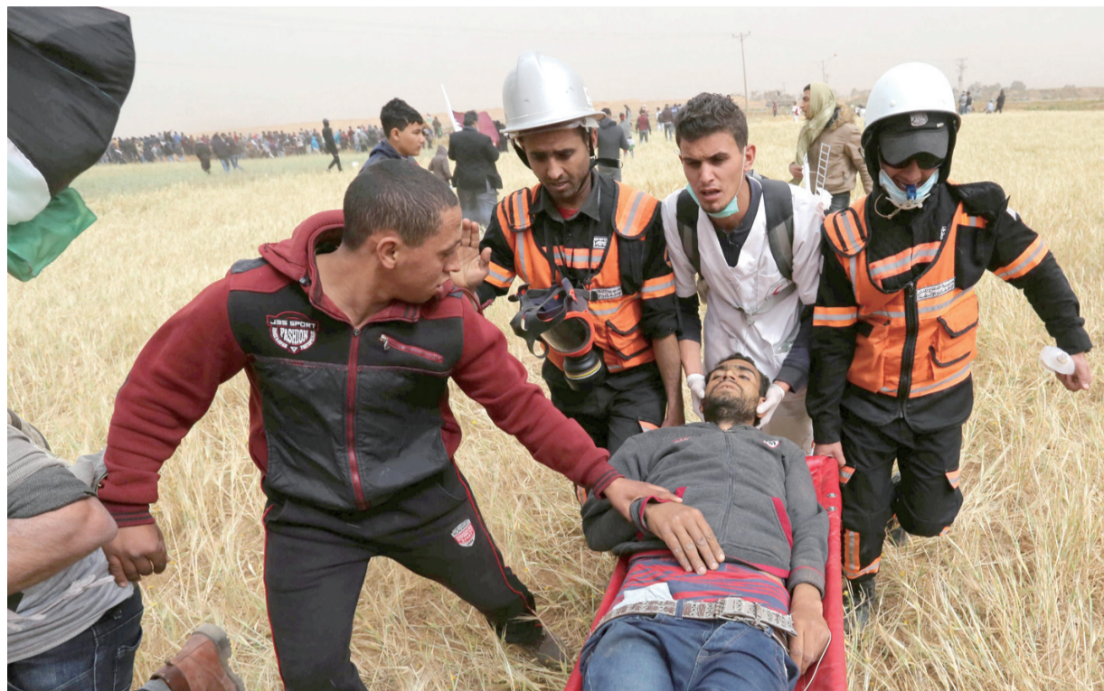
3月30日,在加沙地带与以色列交界区域,医护人员转移一名伤者。