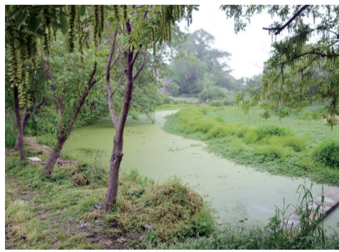
洪溪古河道

大港河入江通海,在改革开放的大潮中,大港河口兴建远洋码头,拉开了新时代的序幕。今天她承载着镇江新区的汗水与希望,走向大洋,拥抱未来。