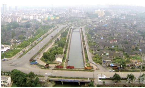
大港河千流

大港河的名字很有意思,1994年编的《大港镇志》记述:“大港始名洪溪……南宋初年,抗金名将韩世忠驻守圔山,开三十六港操练水师。因三十六港中数洪溪港最大,加上呼之方便,故改称大港。”(上海社会科学院出版社1994年版,第75页)这一记载的说法,需要澄清。大港地处丘陵,土质坚硬,雨季洪水形成河流,在上世纪70年代前,河床稳定没有多大变化,我所见的大港河是名副其实的“洪溪”。可是,在1080年成书的《元丰九域志》记载“大港”为地名。那时韩世忠(1090—1151)还没有出生,可见大港并非军港得名。东汉许慎的《说文解字》载:“港,水派也”;其后唐宋元明的韵书字典《唐韵》《集韵》《韵会》《洪武正韵》都说港是:水分流也。因支流河口常停泊船只,故“港”便引申为码头,“港”字本义退化是后来的事。南宋《嘉定镇志》记载的“大港”也未失扬子江支流的本质。名字关乎意义,不可本末倒置。大港河名不是来自大港地名,非从属派生,相反大港地名是来自河名。大港生于江河交汇,河乳哺育,大港河是一条母亲河。