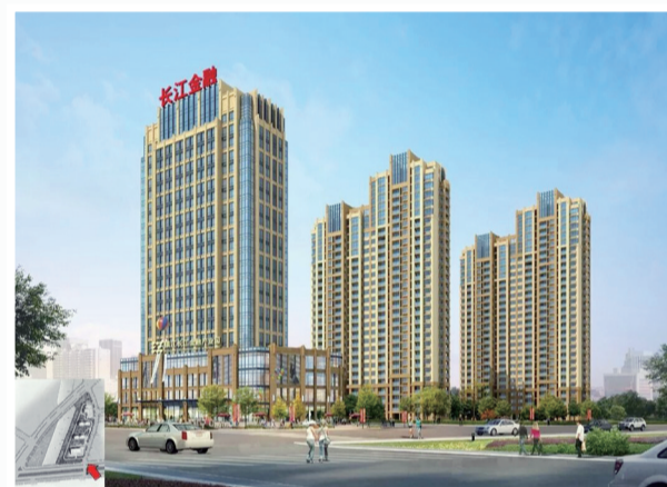
长江金融产业园(效果图)