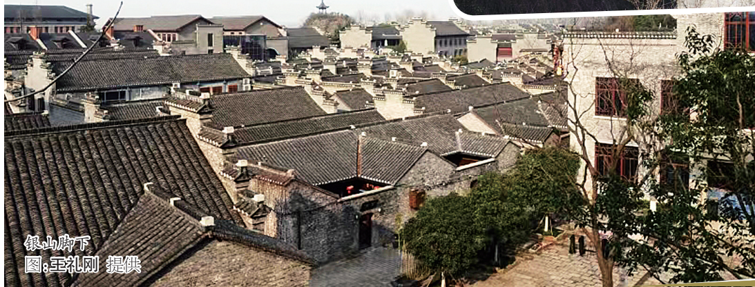
银山脚下

银山得名，银山与金山隔江对峙，地方人士依从求顺求财的完美愿望，遂将蒜山北一段改名为“银山”，临江取名为“玉山”。这样一来，京口與间“金山”、“银山”、“玉山”、“金、银、玉”都有了。