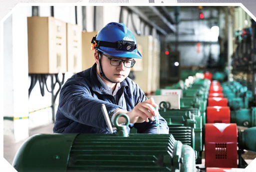
2月5日，国能集团谏壁发电厂员工开展隐患排查和消缺工作。