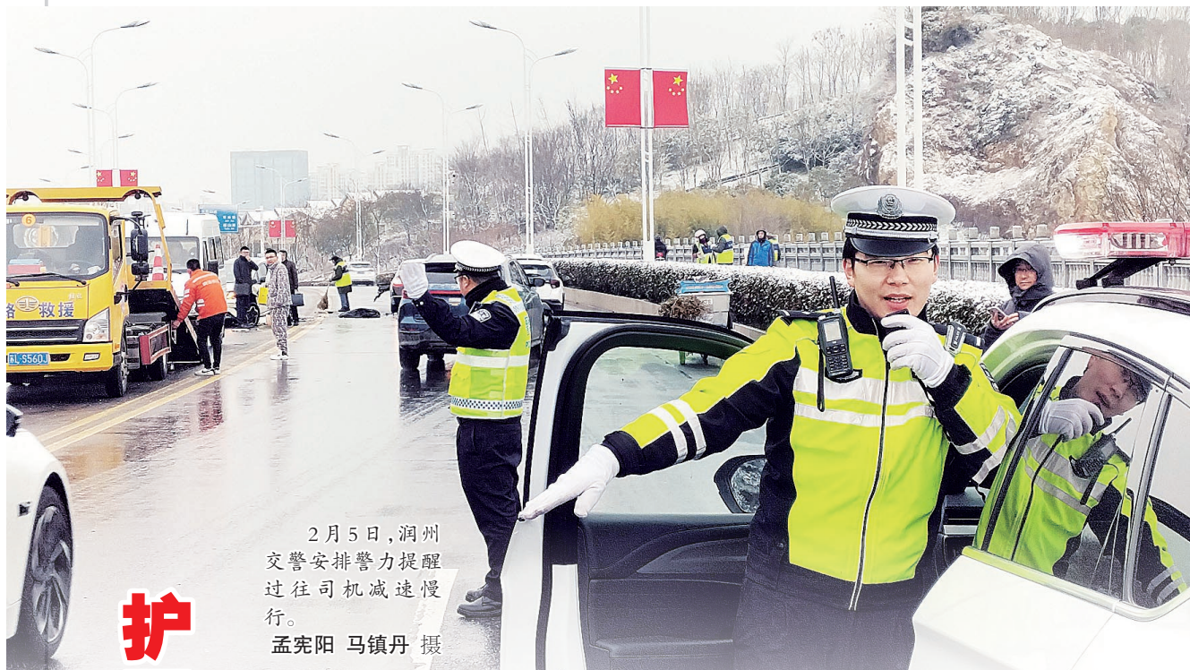
2月5日，润州交警安排警力提醒过往司机减速慢行。