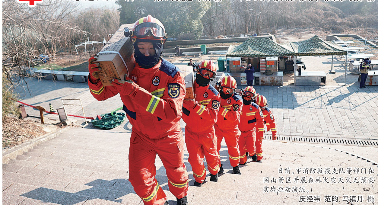
日前，市消防救援支队等部门在园山景区开展森林火灾灭火无预案实战拉动演练。

去年开发岗位18277个， 大专以上岗位11957个 我市就业见习 工作“量质双升”