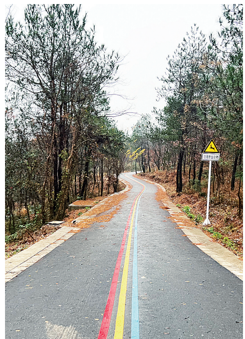
十里长山森林步道