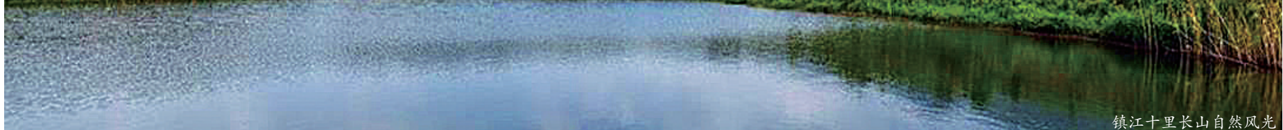
镇江十里长山自然风光

森林步道建设已连续两年被省委省政府列为解决群众反映强烈的“急难愁盼”问题的民生实事。近日，江苏省林业局公布第三批江苏省森林步道名单，镇江五洲山森林步道和镇江十里长山森林步道榜上有名。