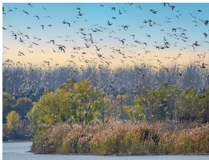
南京长江新济洲国家湿地公园