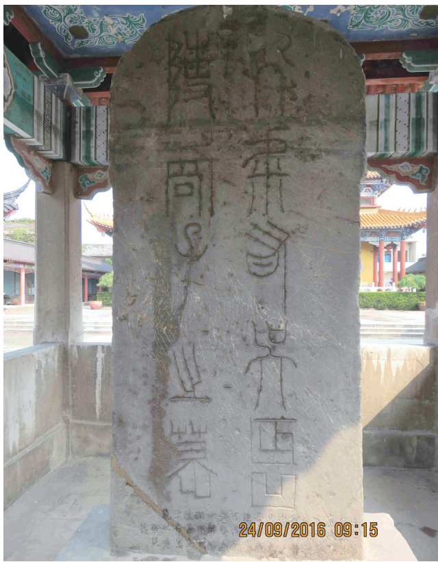
现存的「十字碑」