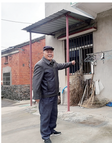
韦金法晚年居住的房屋