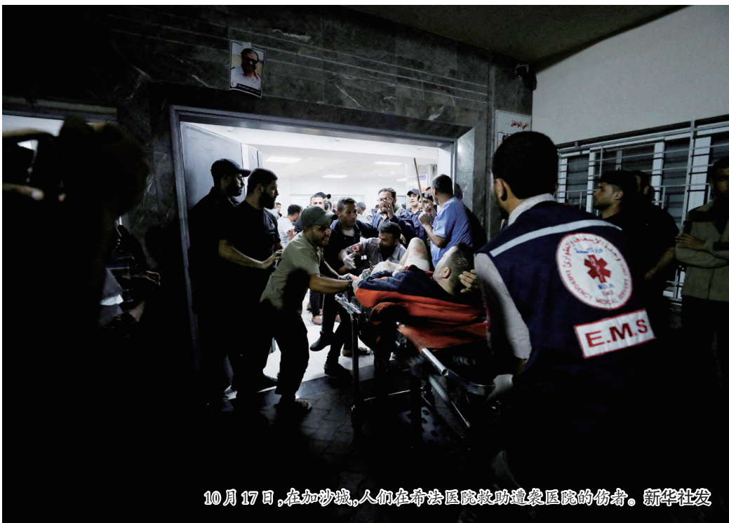
10月17日,在加沙城,人们在希法医院救助遭袭医院的伤者。

登开启中东之行。阿巴斯17日宣布退出原定次日在安曼举行的约巴埃美四方峰会;约旦方面则宣布取消会晤。