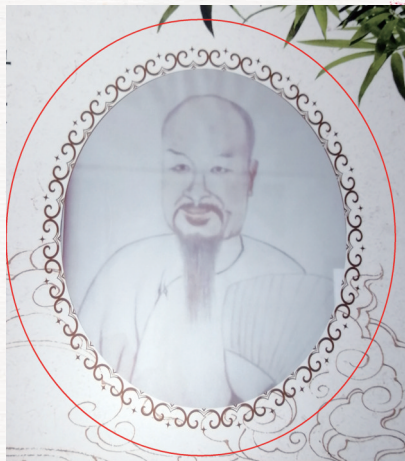
清代书法大家王文治