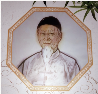
清代医学家、杂家缪鏊