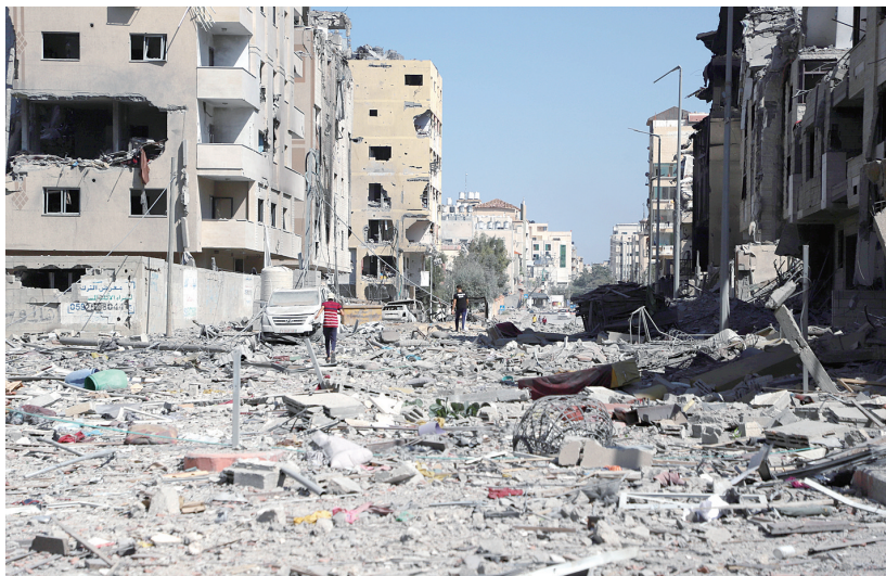
这是10月13日在加沙城拍摄的遭以色列空袭损毁的建筑。

巴勒斯坦伊斯兰抵抗运动(哈马斯)14日说,哈马斯政治局领导人伊斯梅尔·哈尼亚当天在卡塔尔首都多哈会见伊朗外交部长侯赛因·阿米尔-阿卜杜拉希扬,讨论巴以新一轮冲突。