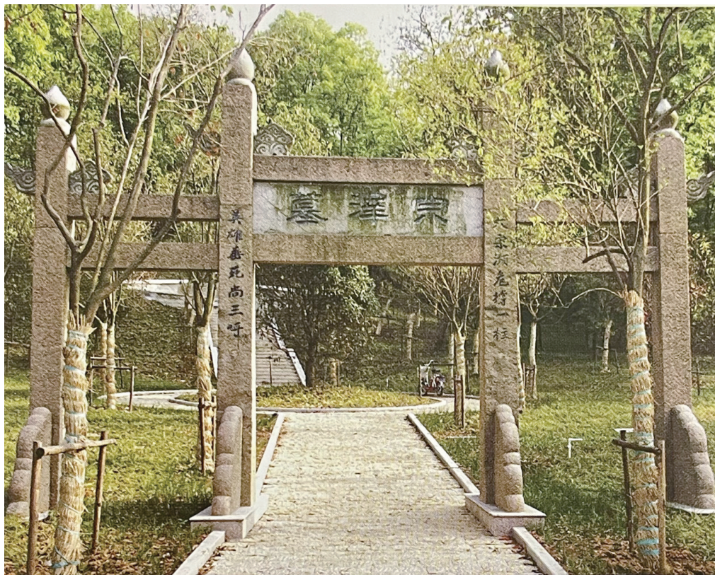
□ 张剑 马彦如