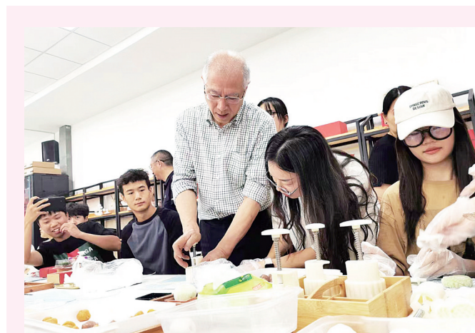
为弘扬传承中华优秀传统文化，镇江高专艺术设计学院开展系列活动，在中秋佳节当日，学院领导、老师与假期留校学生一起做月饼、抽大奖、展才艺，热热闹闹过中秋。