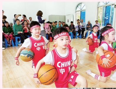
日前，镇江新区大路中心幼儿园的孩子们来到大路村居家养老服务中心，为老人们献上一场精彩的迎中秋庆国庆文艺展演。