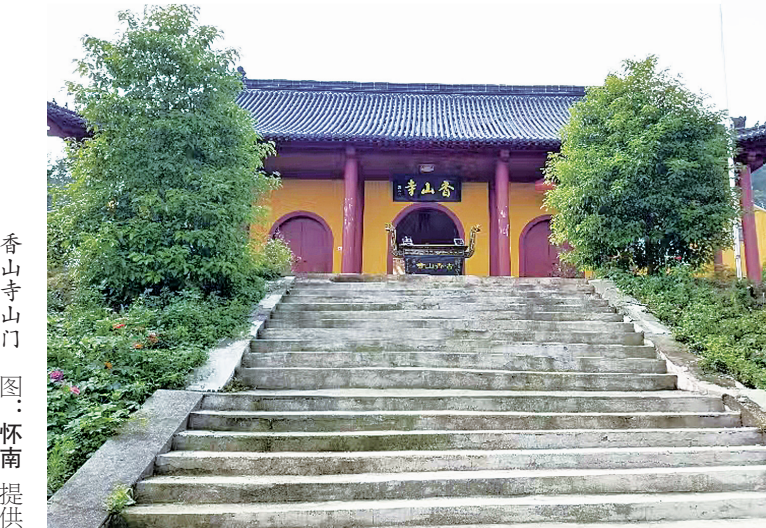
香山寺山门