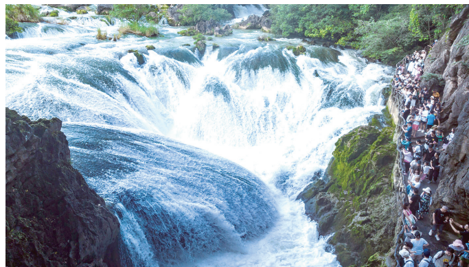
贵州黄果树瀑布:清凉避暑醉游人

数据显示,从2021年到2022年,上海已建成62座开放休闲林地,其中8座是千亩以上景观游憩型开放休闲林地。2023年,上海有6座千亩开放休闲林地、58座小微开放休闲林地开始建设,其中15座小微开放休闲林地已完成施工。