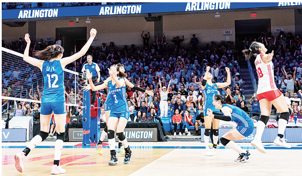
中国队球员在比赛后庆祝。

新华社美国阿灵顿7月15日电 创造历史！中国女排15日在2023年世界女排联赛总决赛的半决赛中放松心态，气势如虹，以3:0力克头号种子波兰队，首次冲进世联赛冠军争夺战。