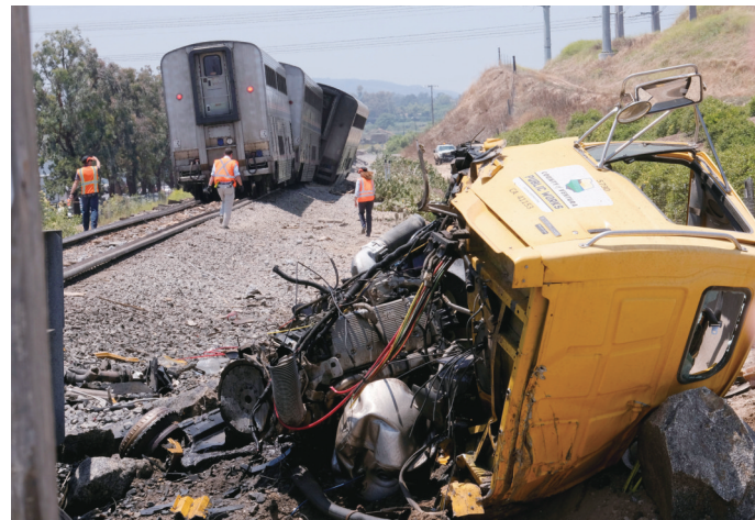
这是6月28日在美国加利福尼亚州穆尔帕克拍摄的与列车相撞的汽车残骸。