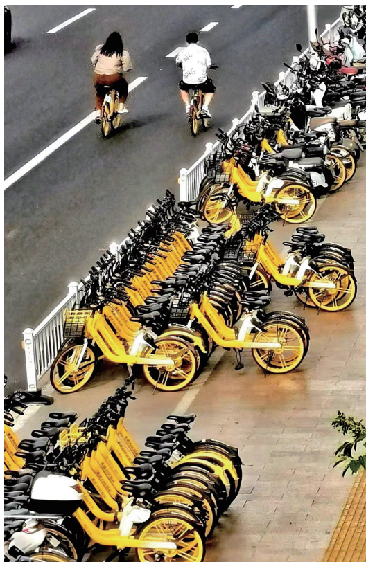
6月11日,北京石景山区地铁古城站旁,整齐摆放着共享单车,供市民使用。大家都很喜欢这种便捷低碳的出行方式。