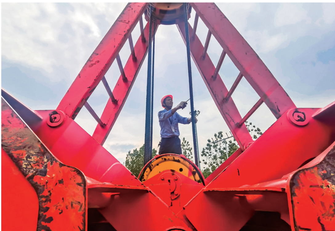
日前,江苏镇江港发集团大路港务公司,一名门机司机在进行固定吊钢丝绳的点检保养,为设备安全生产作业提供保障。