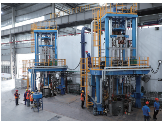
6月17日,江苏天工国际20吨气氛保护电渣炉正式通电试产,标志着天工大型电渣锭生产能力进一步提升,为大型一体化模具钢生产提供基础保障。