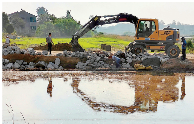
6月10日,江苏镇江丹徒区上党镇五塘村。为进一步改善乡村的交通条件,建设者们正在对“五塘-小力山”的道路进行拓宽、升级。