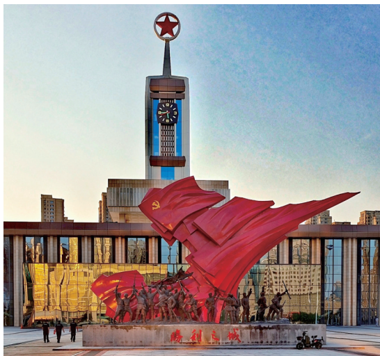
原先的河北石家庄解放纪念馆规模较小,今年,该市把石家庄老火车站改建成了新的纪念馆,详实生动地展现石家庄解放的光辉历程。