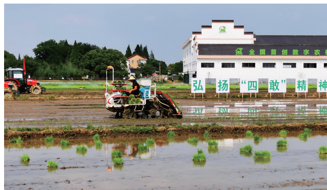
农机数字化,是农业现代化的重要内容。6月12日,江苏省农机数字化现场推进会在无锡召开,无锡锡山区严家桥综合农事服务中心组织了智能水稻插秧机竞技比武。