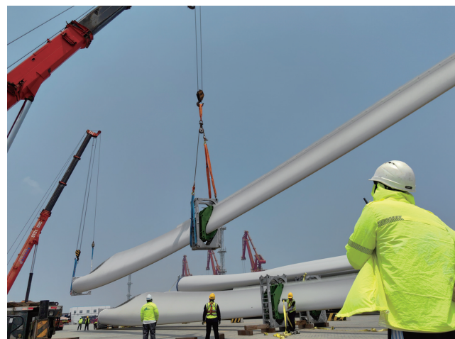
6月8日,江苏南通通州湾新出海口——吕四起步港区,工作人员正忙着吊运风电叶片。