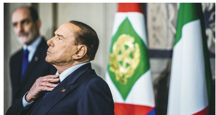
这张资料照片显示的是,2018年4月12日,意大利前总理贝卢斯科尼在罗马出席记者会。

意大利总理梅洛尼表示,贝卢斯科尼是一位斗士,“他不害怕捍卫自己的信念,正是这种勇气和决心使他成为意大利历史上最有影响力的人物之一”。