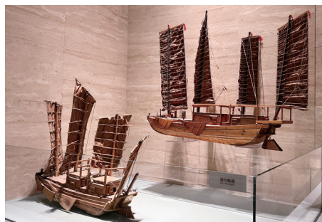
敏成小学一(2)班 丁沐文 摄

大运河博物馆之行不仅让我领略到了各种展品的精致和美观，还让我了解了大运河的悠久历史，我真想再来一次！（指导老师 许月霞）