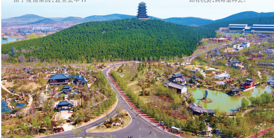
园博园春意盎然

四月的招隐寺目之所及皆杜鹃。我们一行人愉快地从山里走出,不远处一片五彩缤纷、灿烂如锦的花圃跃入眼帘。大约两亩见方的花圃种植着30余种200多株珍稀的西洋杜鹃。每朵杜鹃花的色和形各有特点,娇艳无比,让人眼界大开。根据花圃旁的文字介绍:这是市杜鹃花协会为配合景区每年一度的杜鹃花节精心培植的,主要品种有星之辉、五宝绿珠、五彩日光、碧空菊姬等。这正是:青山绿隐杜鹃花,岭叠风翻涌彩霞。