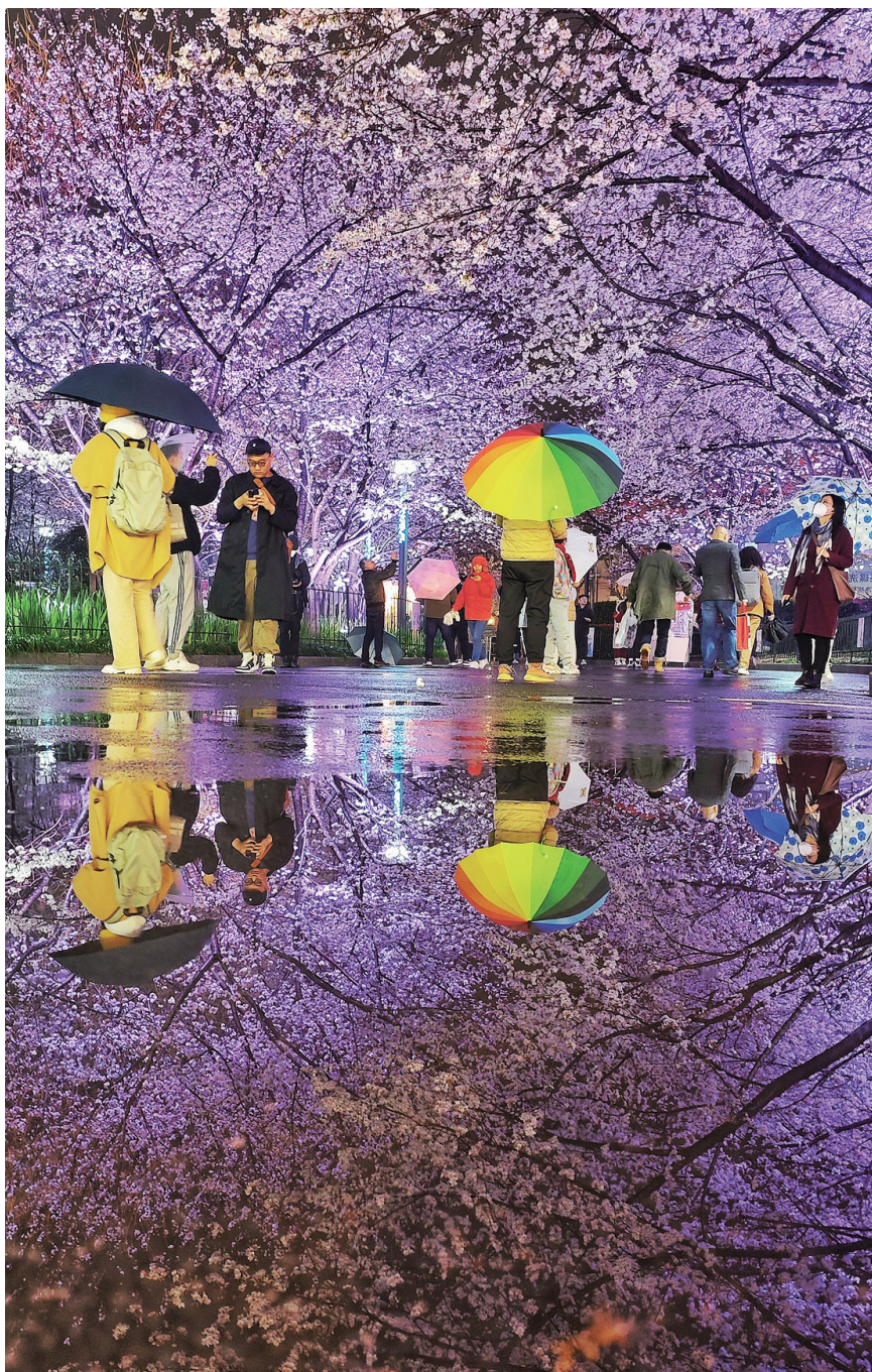
春雨绵绵,上海轨交8号线虹口足球场站旁的樱花林已成片绽放,在灯光的点缀下梦幻绚丽,与积水中的倒影浑然一体,更显诗意。