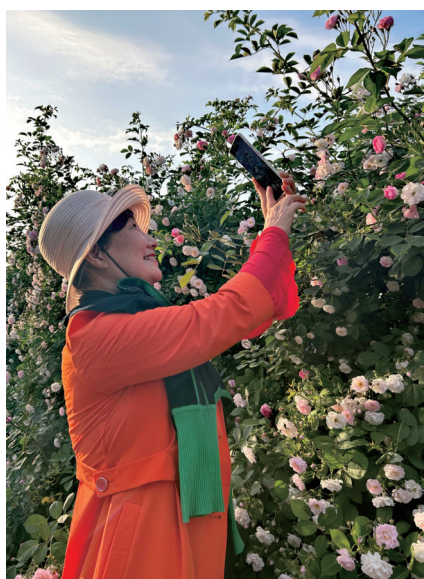
4月21日,江苏镇江句容。百米网红蔷薇墙,打卡赏花正当时。