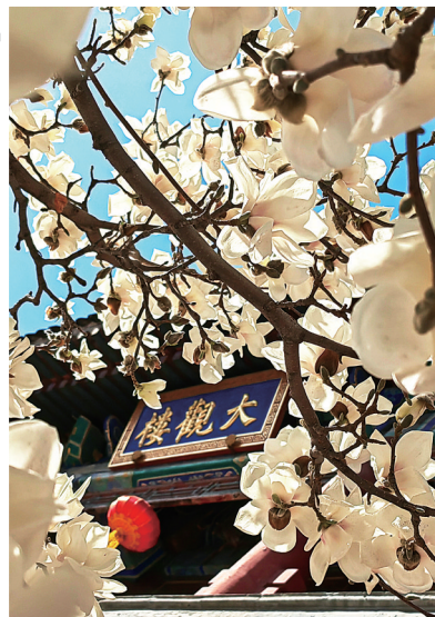
司马小萌建议:照片挺美。还想更美吗?那么,跟我来,左一刀,右一刀。再提高一点对比度。