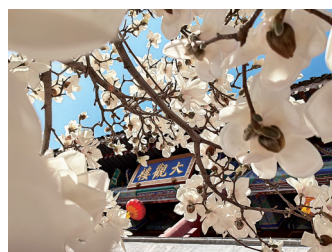
春暖花开,北京大观园的“大观楼”匾额,在白玉兰的映衬下更加夺目。北京