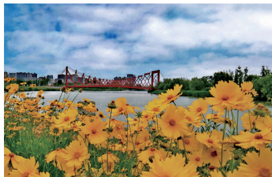
4月15日,江苏扬州三湾公园古运河边,透过重重叠叠的金鸡菊,眺望极具中国韵味的剪影桥。