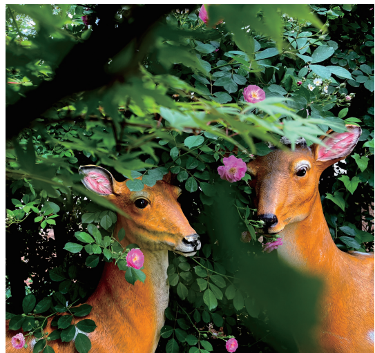
4月18日,河南信阳市湖东大道一小区内,攀栏生长的蔷薇花盛放,叶绿如毯,花繁似锦,躲在这绿篱里的两只“小鹿”,似乎也沉醉在这春日美景中。