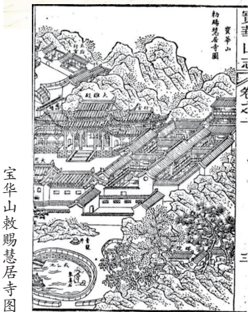
宝华山敕赐慧居寺图

宝华山林麓之美，峰峦之秀，洞壑之深，烟霞之胜，号称名山四大奇秀。山间常年云雾缭绕，景色优美，特别是盛夏季节，气候宜人，为江南避暑佳境。